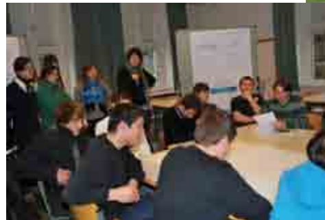
Danube Environment Forum 2013, Tulcea/Romania